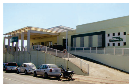
Hospital da Unimed

Endereço: Av. Porto Alegre, 132 D, Centro - Chapecó/SC.