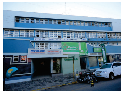
Centro Hospitalar Santanense

Endereço: Av. Tamandaré, 2880, Centro - Santana do Livramento/RS.