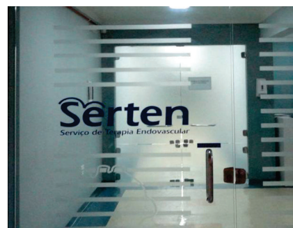
Serten - Serviços de Hemodinâmica

Endereço: Rua Gomes Carneiro, 1350 - Anexo a Santa Casa - Bagé/RS.