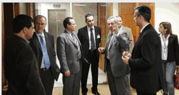
Visita aos setores da entidade.